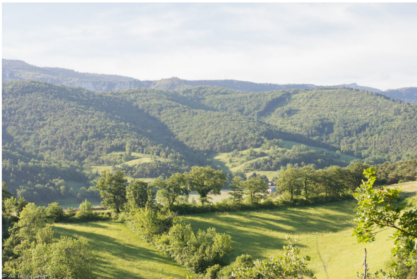
L'horizon des contreforts du Vercors apparaît au loin