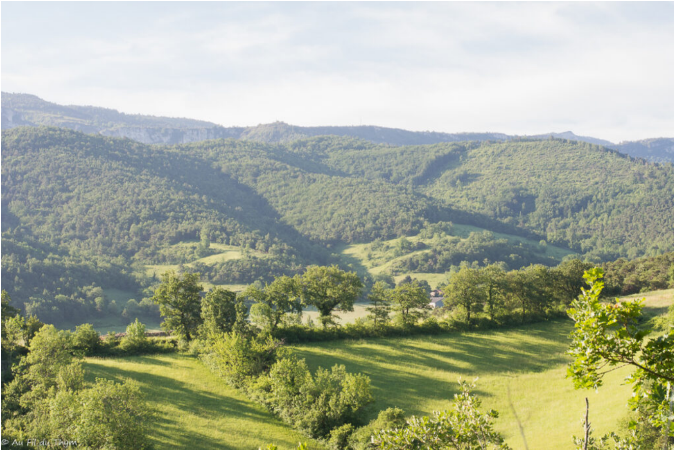
L'horizon des contreforts du Vercors apparait au loin