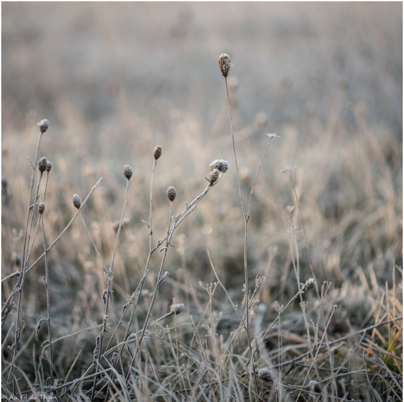
Des chardons roland qui étendent leurs petites boules vers le ciel