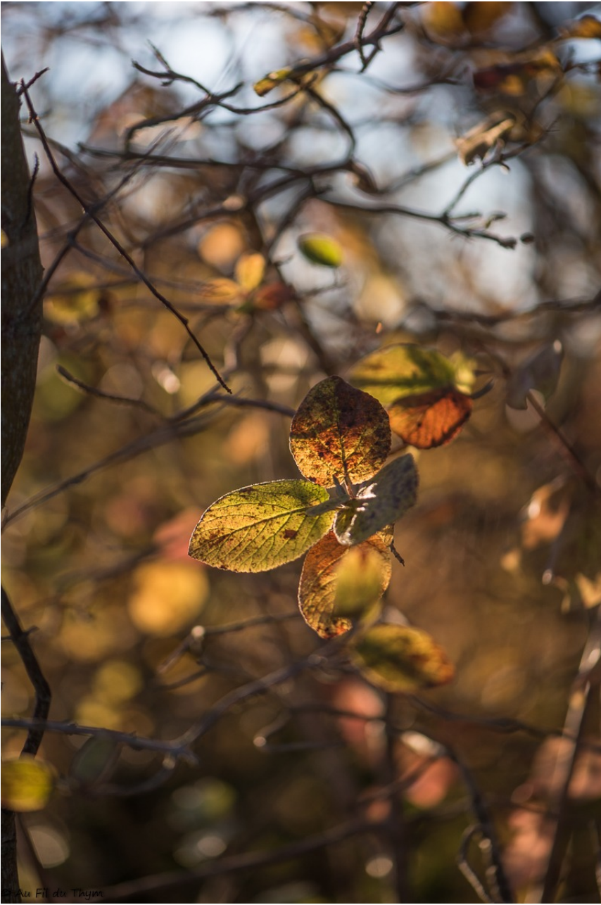
Certaines en deviennent presque transparentes...