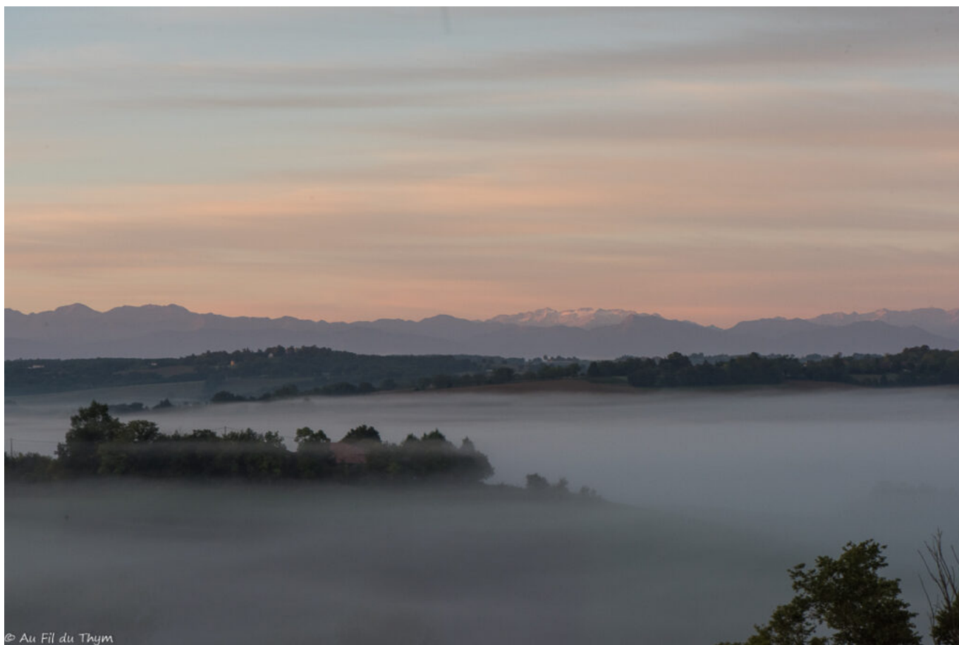
Le soleil atteint le sommet des Pyrénées