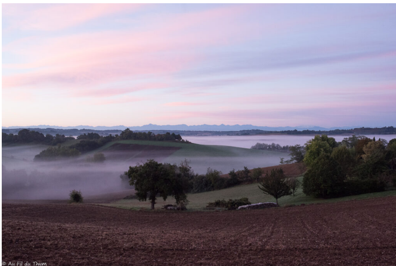
Atteindre le point culminant alors que le ciel prends des teintes roses et