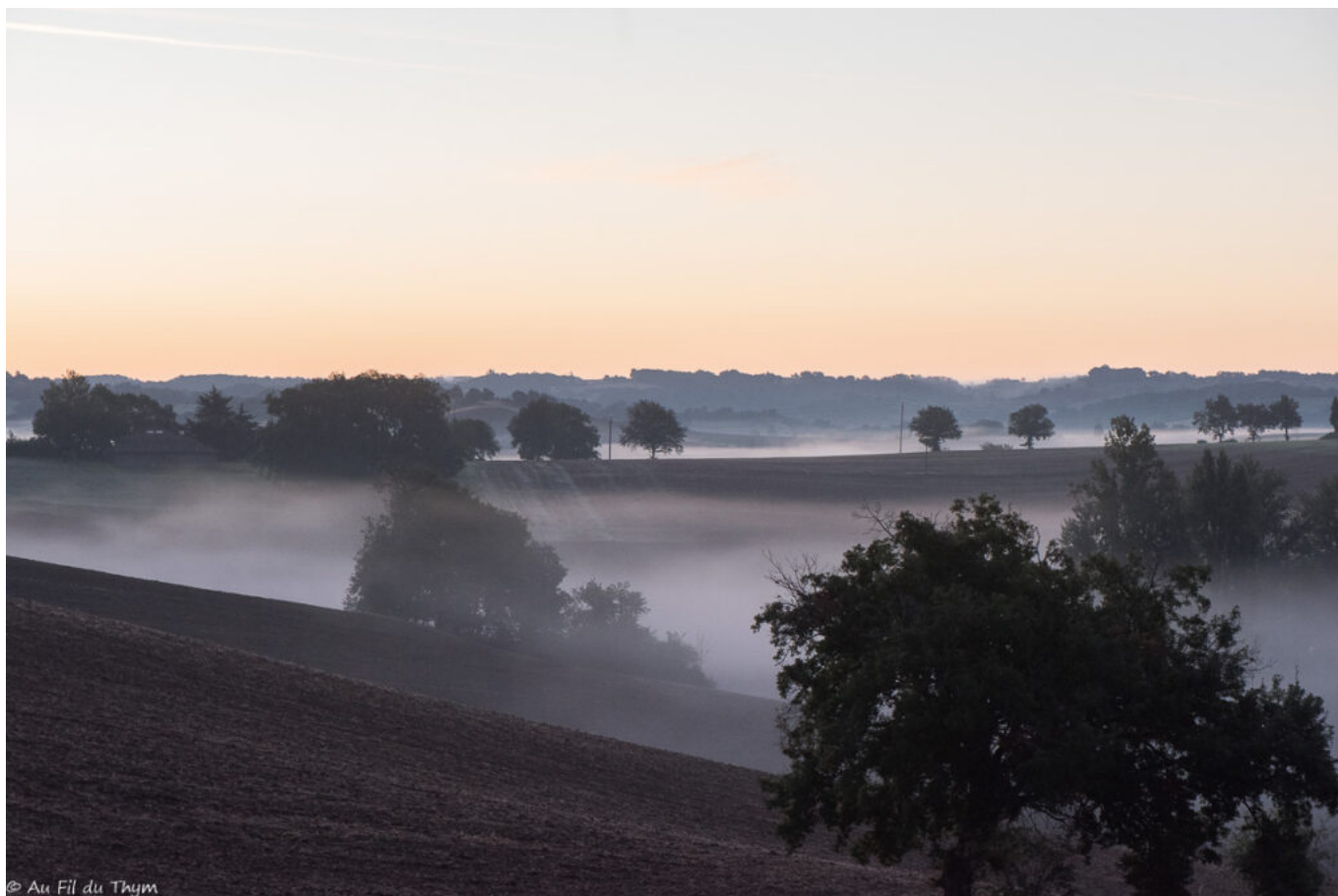
Couleurs roses de l'aurore