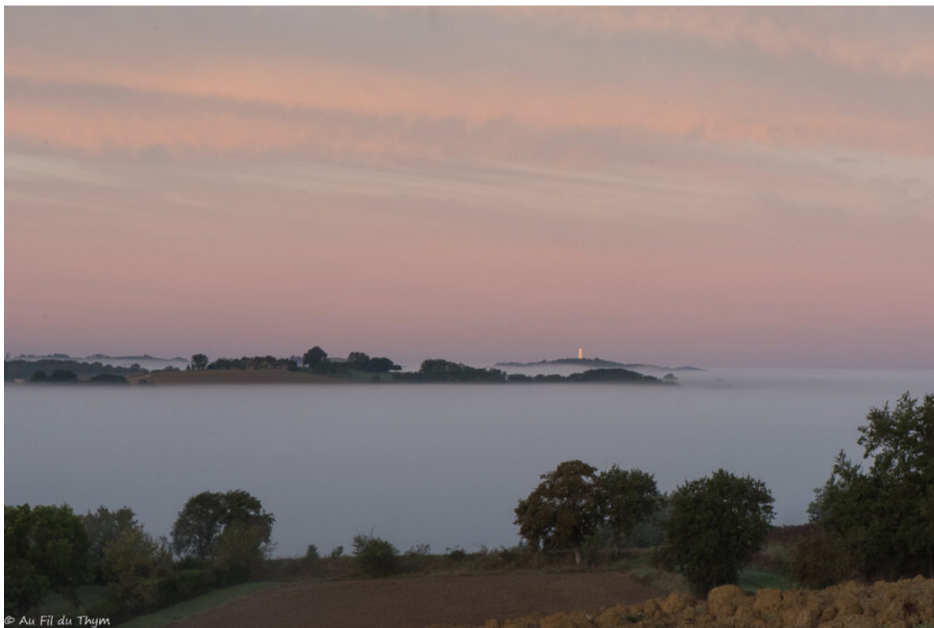
Le soleil atteint le sommet des Pyrénées