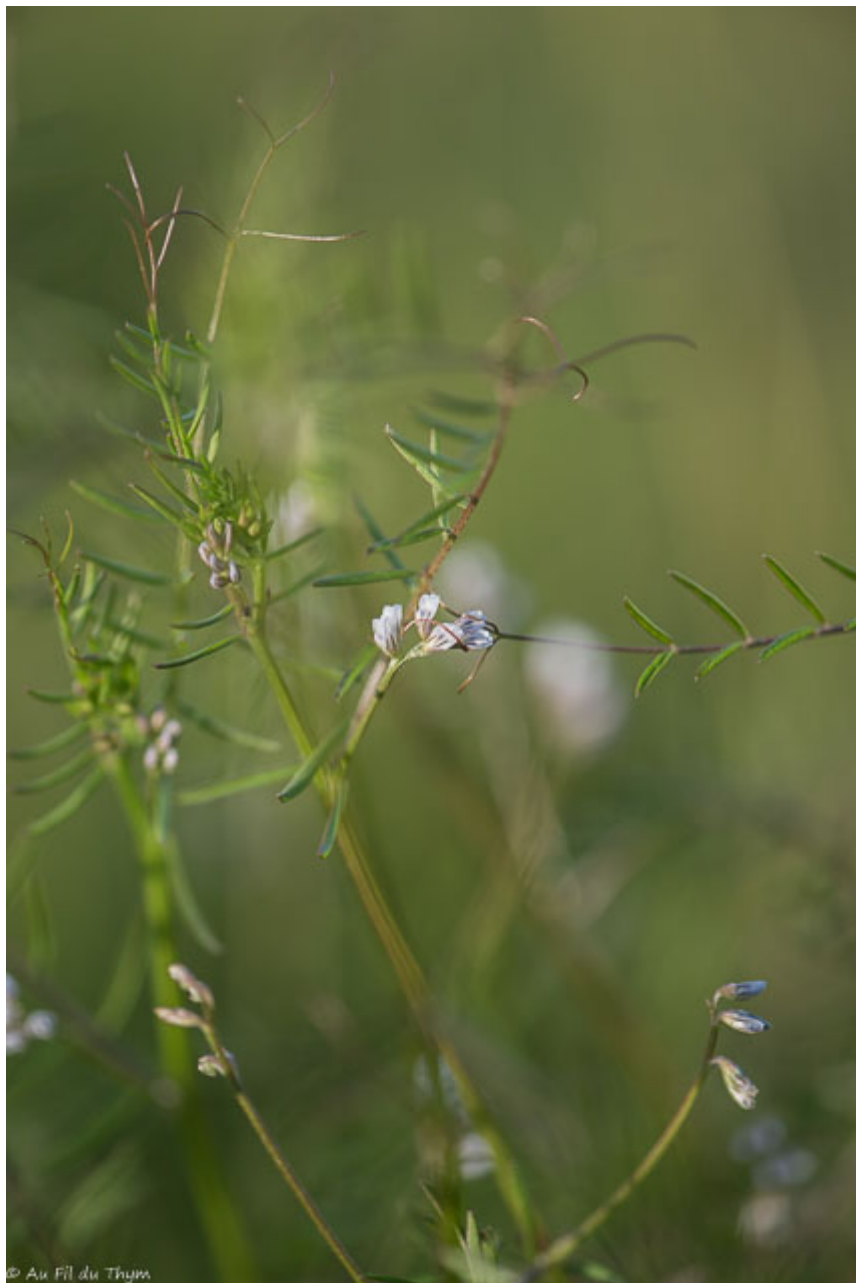
© Au Fil du Thym Ers Lentilles

Un peu plus loin, en beaucoup moins discret, on peut retrouver des touffes de plantes aux feuilles très fines dont les fleurs peuvent ressembler aux marguerites. Il s'agit de la camomille des chiens , une asteraceae messicole. Son nom viens de son odeur assez « piquante » et nauséabonde quand on la secoue. (Nombreuses fleurs ont d'ailleurs ce surnom « des chiens » quand l'odeur n'est pas agréable. ) Vous n'aurez aucun mal à en trouver proche de chez vous.