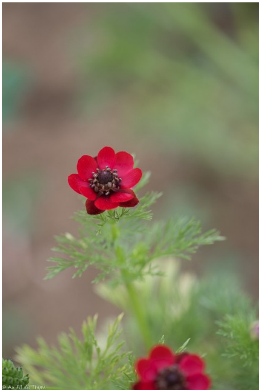
Adonis Goutte de sang

Discrète, petite, et en fin de floraison, la pensée des champs avait également envahi les lieux. Version sauvage de nos pensées des jardins, elle présente des fleurs plus petites mais plus nombreuses.