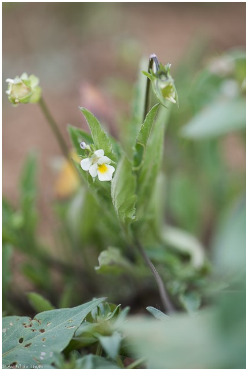
Pensée des champs

Continuons la balade pour rejoindre un autre champ où nous pouvons observer des nigelles des champs . Vous avez peut être l'habitude des nigelles de Damas de vos jardins, voici la version sauvage « made in France ». Vous remarquerez qu'elle a moins d'attraits esthétiques avec moins de pétales. Mais elle intéresse beaucoup les butineurs.