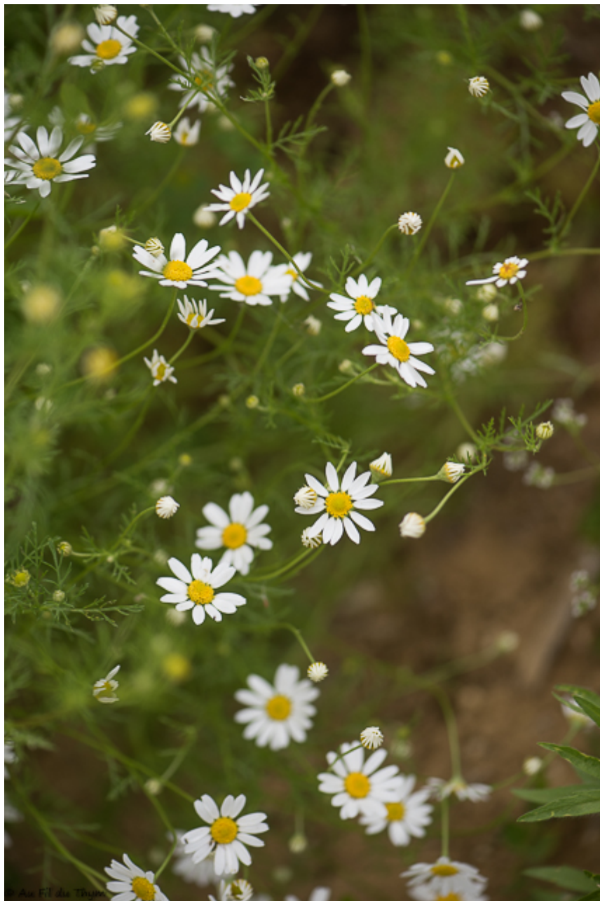
Camomille des chiens

Et terminons par une grande plante que l'on trouve plus aisément en bord de champ que dedans, vu sa taille : le chardon-marie . Ce chardon se reconnaît assez facilement par ses grandes feuilles vertes et blanches, bordées de dents piquantes. Sa fleur rose peut évoquer l'artichaut. Il est réputé depuis l'antiquité pour des propriétés médicinales pour soulager des troubles hépatiques et biliaires. Il n'est pas rare de le retrouver aujourd'hui dans les produits de phytothérapie.