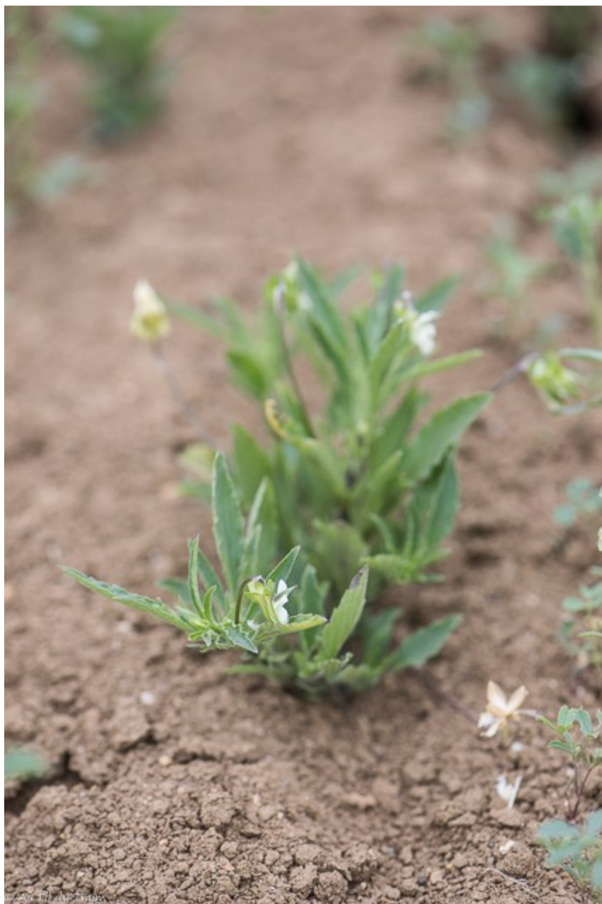
Pensée des champs