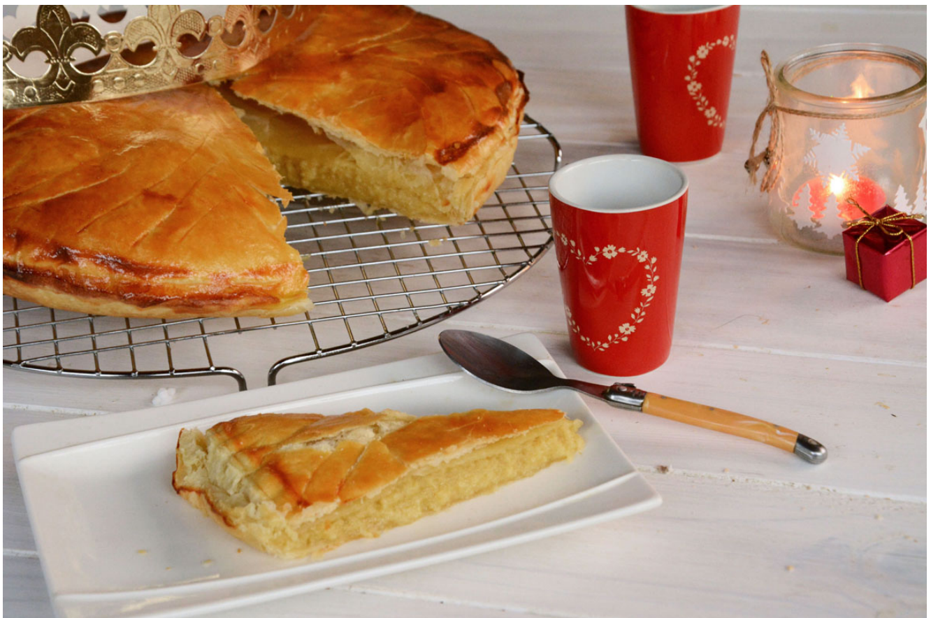
Galette des rois frangipane