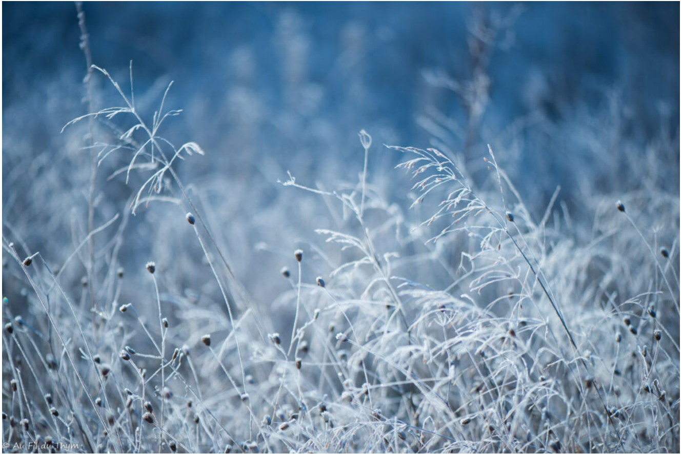
Féerie du Givre